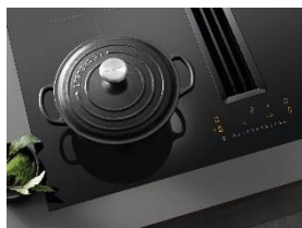
Immagine 1: Il piano cottura a induzione Miele KMDA 7272 Silence si è aggiudicato l'iF Design Award 2023 per il suo design accattivante ed elegante, affermandosi anche come reddot winner 2023. (Immagine: Miele)